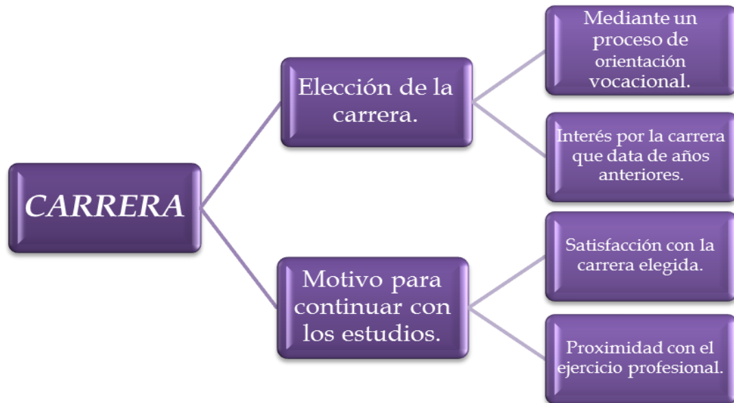
Figura 2. Mapa conceptual: Carrera.