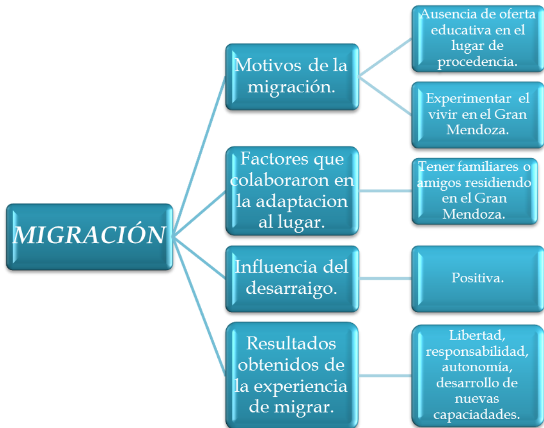
Figura 1. Mapa conceptual: Migración.

Para realizar la presentación de los resultados obtenidos en la presente investigación se mostrarán en un primer momento figuras del tipo mapa conceptual de cada una de las metacategorías y sus correspondientes categorías con resultados generales obtenidos a modo de síntesis, a los fines de una fácil interpretación de los resultados. Luego se profundizará presentando tablas divididas según sexo y categoría junto con breves fragmentos más representativos de los relatos de los sujetos participantes de la investigación.