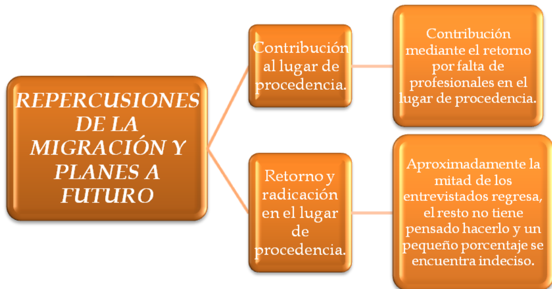
Figura 5. Mapa conceptual: Repercusiones de la migración y planes a futuro.

Como se expuso anteriormente se presentarán las tablas correspondientes a las Meta categorías y categorías con breves fragmentos de las entrevistas.