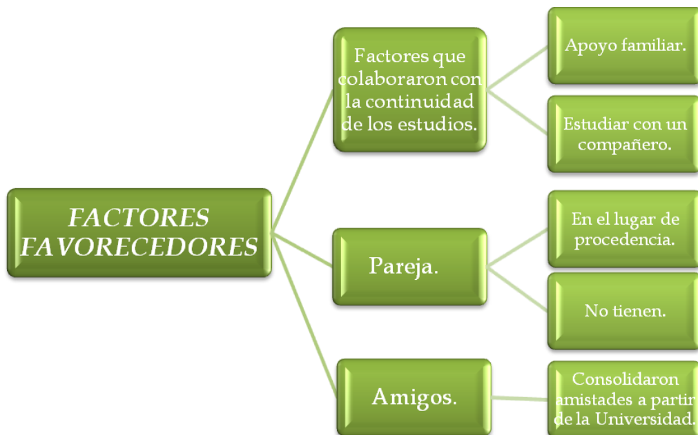
Figura 3. Mapa conceptual: Factores favorecedores.